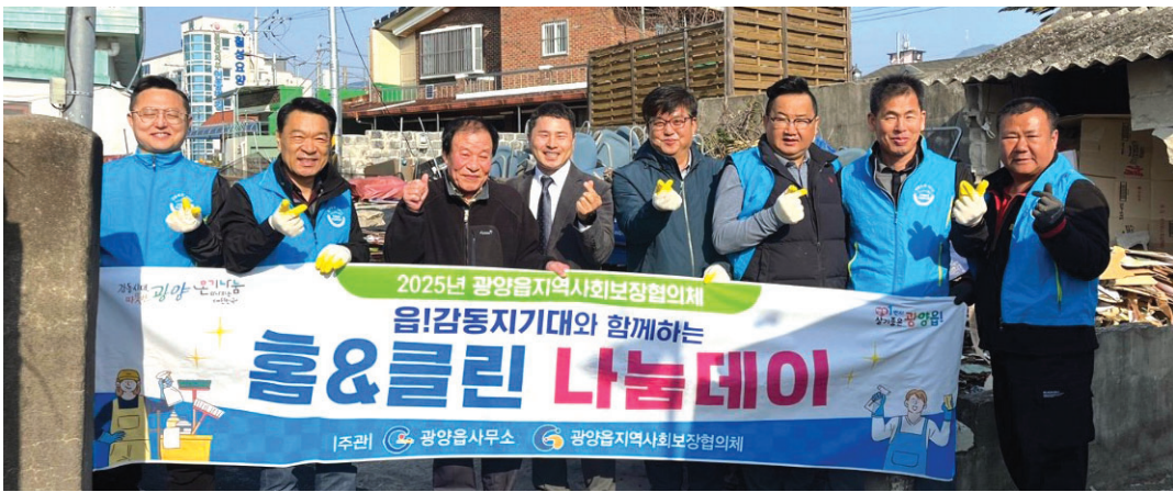
‘읍!감동지기대’ 대원들은 지난해 홈&클린 나눔데이 행사를 진행했다.

대상자 중 다수가 저장강박증으로 어려움을 겪고 있었다. 대원들은 쓰레기 더미 속에 고립된 이웃을 찾아가 악취와 오물로 가득했던 공간을 비워내고 당장이라도 무너질 듯 위험한 구조물은 무상으로