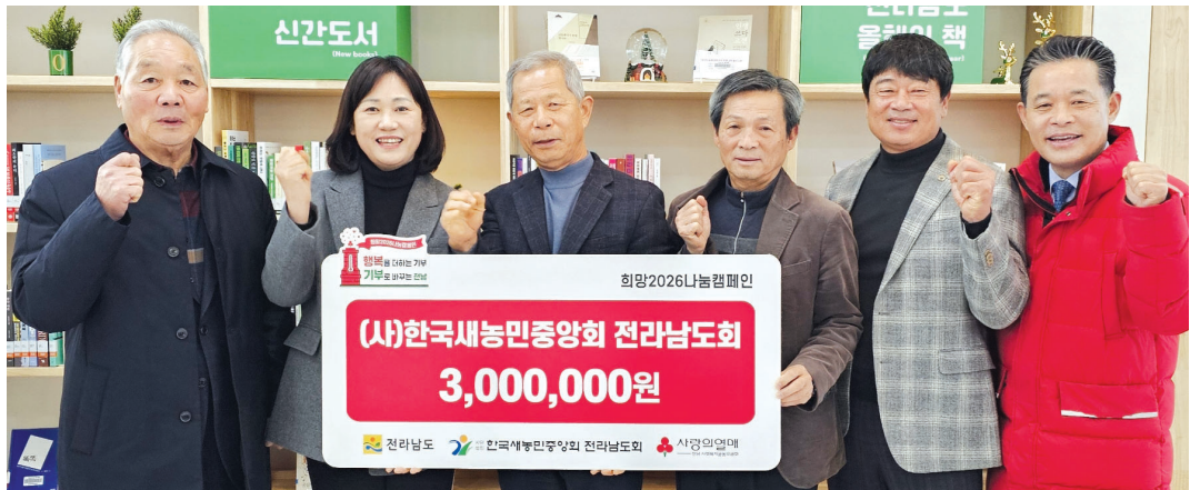
(사)한국새농민중앙회 전남도회 임원진들이 경제적으로 어려운 이웃과 취약계층을 돕기 위해 마련한 성금 300만원을 전남사랑의열매 ‘희망2026 나눔캠페인’에 전달했다.