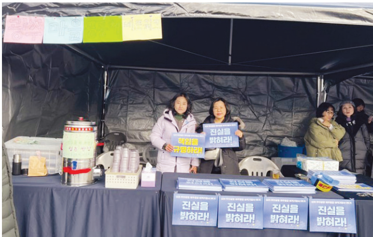
광주로가 지난해 12월 27일 12-29 무안공항 제주항공 여객기 참사 1주기를 맞아 진행한 광주-전남 시민추모대회.

산하 연구소 및 퇴임 교수진과 협력해 시민들이 인문·사회 등 다양한 분야의 소양을 쌓을 수 있는 교