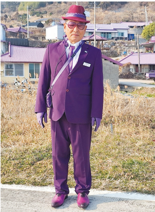
머리에서 발끝까지 보라색으로 무장하고 퍼플섬 매력을 알리는 장청군 섬 코디네이터.

랑 이야기가 전해져요. 밤마다 들려오는 반월도 비구니의 목탁 소리에 마음을 뺏긴 박지도의 젊은 비