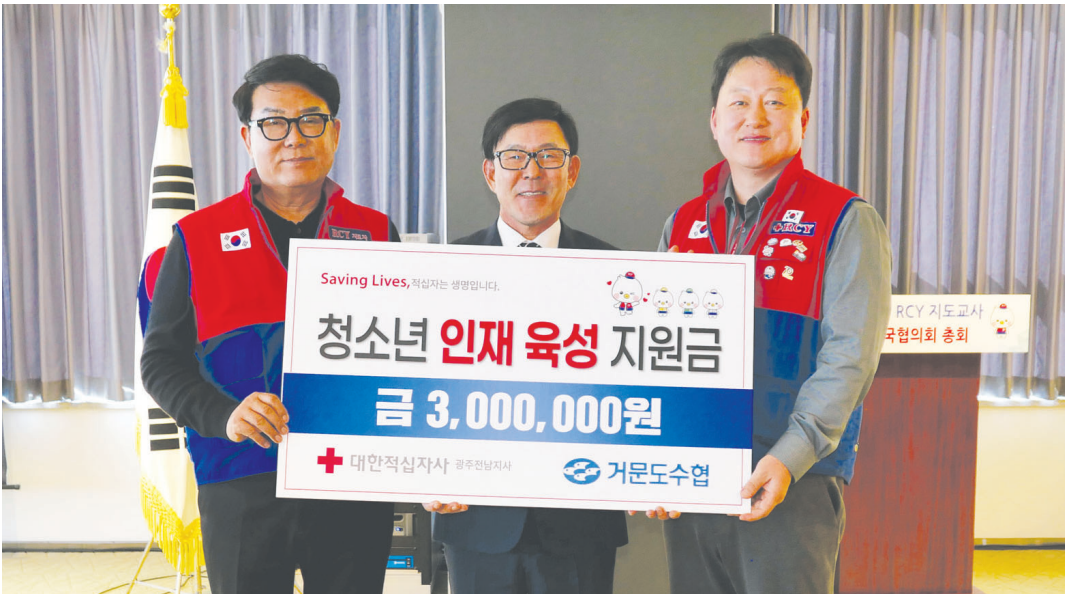
거문도수협은 최근 열린 ‘2026년도 대한적십자사 RCY 지도교사 전국협의회 총회’에서 대한적십자사 광주전남지사에 청소년 인재 육성을 위한 기부금 300만원을 전달했다.