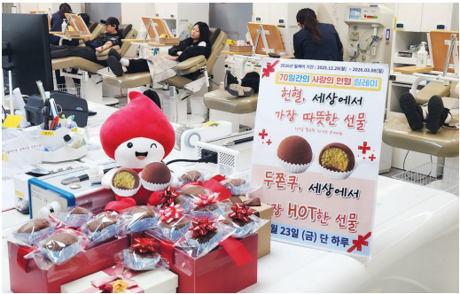
광주 총장헌혈의 집에 준비된 두쫘쿠 증정품.

들에게 두쫘쿠 이벤트 홍보를 요청했다. 실제 업로드 된 인스타 게시글은 수천건에 달하는 공유수를 기록하기도 했다.