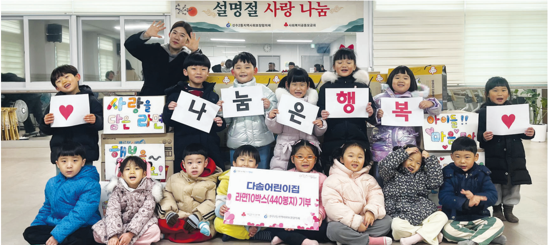
다솜 어린이집이 어려운 이웃을 돕기 위해 원생 54명과 학부모가 함께 모은 라면 10박스를 산수2동에 전달했다. 다솜 어린이집은 매년 아나바다 장터 수익금을 기부하고 있다. <광주 동구 제공>