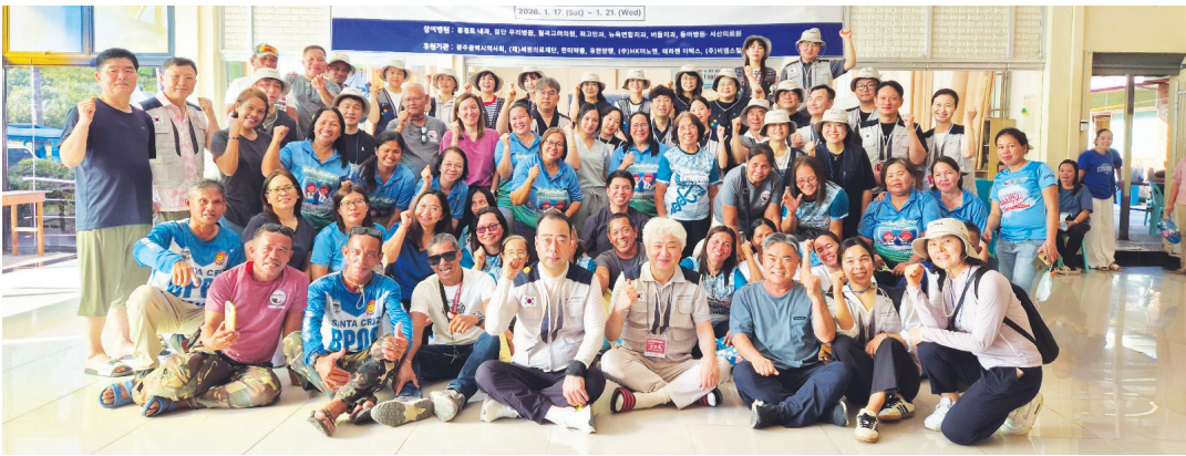
광주국제협력단이 지난 17일부터 6일간 일정으로 필리핀 바클라운서 무료 진료 및 봉사 활동을 펼쳤다.