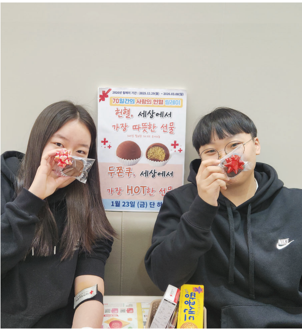
대한적십자사 광주전남혈액원은 ‘두쫘꾸 증정 이벤트’를 진행해 혈액 수급을 안정화했다.