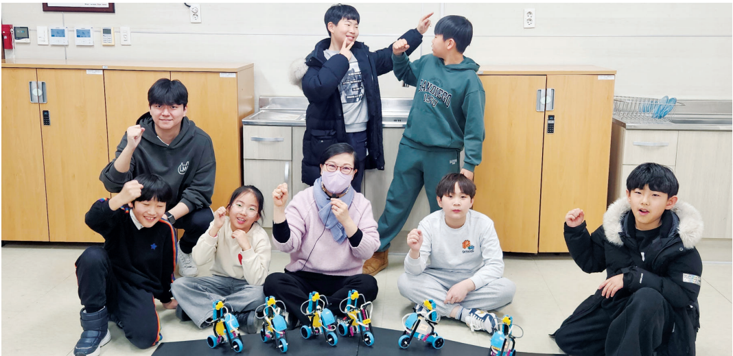
조선대학교(총장 김춘성) AI·SW교육센터가 장성공공도서관과 함께 장성 지역 초등학교생 대상 AI·SW 교육 프로젝트 ‘로봇 코딩으로 만드는 장성 레고 스마트 시티’를 성료했다.