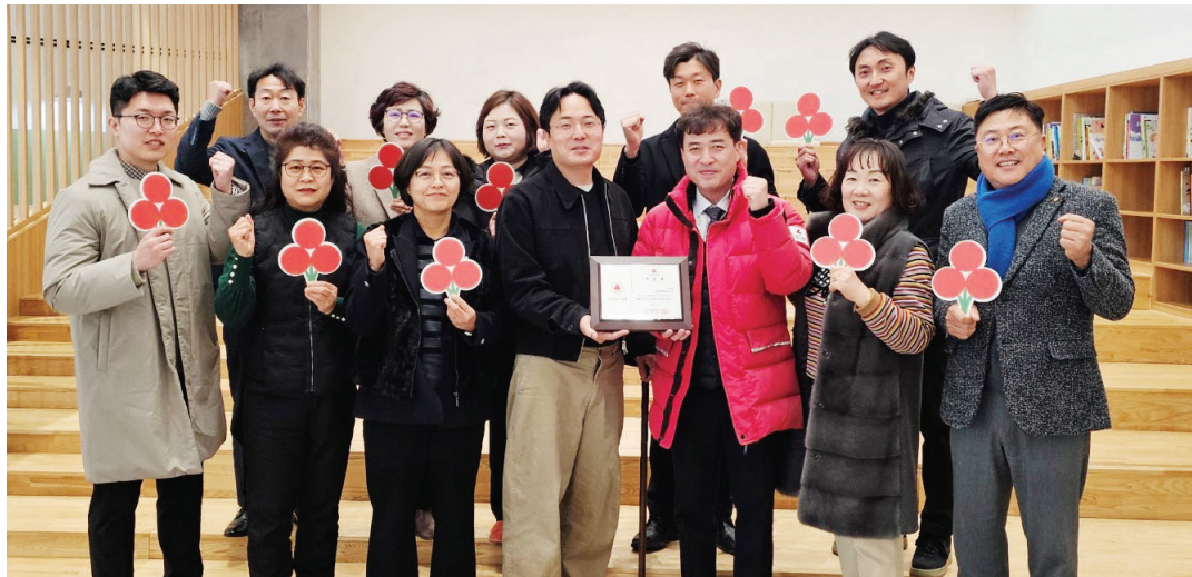
트리마제 순천1단지 주민들이 3년 내 1000만 원 이상을 일시 또는 약정 기부하는 전남사랑의열매 나눔리더스클럽에 2026년 1호로 가입했다.