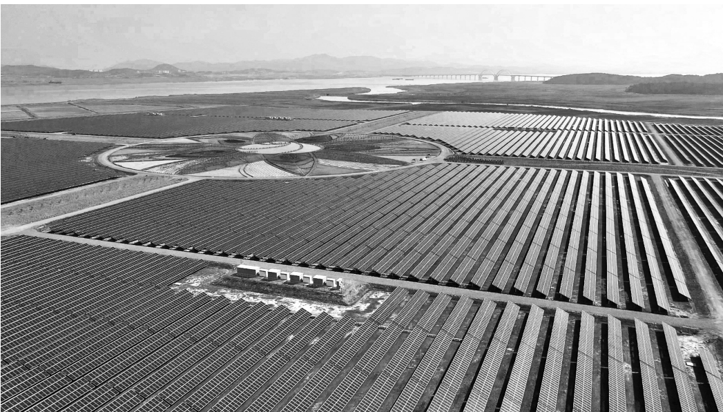
해남군이 신재생에너지 군민펀드 조성 and 신재생에너지주식회사 설립에 착수했다. 솔라시도 재생에너지 산업단지.

재생에너지 이익공유 관련사업을 전문으로 추진하기 위한 주식회사 설립도 속도를 높이고 있다. 주식회사는 해남군 100% 출자기관으로 재생에너지 개발 이익의 외부유출을 방지하고, 대규모 재생에너지 사업에 대한 군과 군민 참여를 확대해 수익을 환원하는 구조를 설계하고 있다. 지난해 설립계획 수립 연구용역에 착수한 상태이며 관련 절차를 거쳐 내년 초 설립을 목표로 하고 있다.