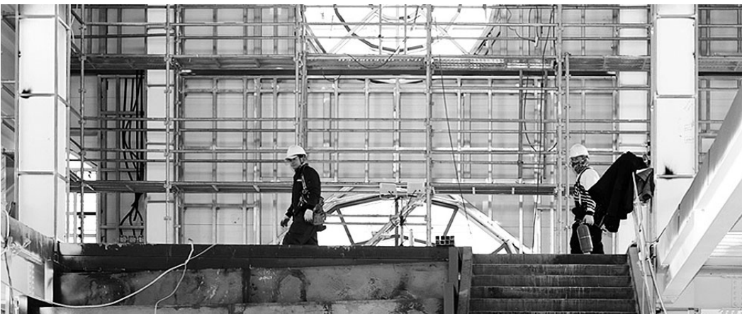
전남형 지역성장 전략사업 1004섬길역 조성사업 현장 점검.

신안군은 이번 현장 점검을 계기로 공공시설과 주요 사업장 등 군 전반에 대한 시설물 안전점검을