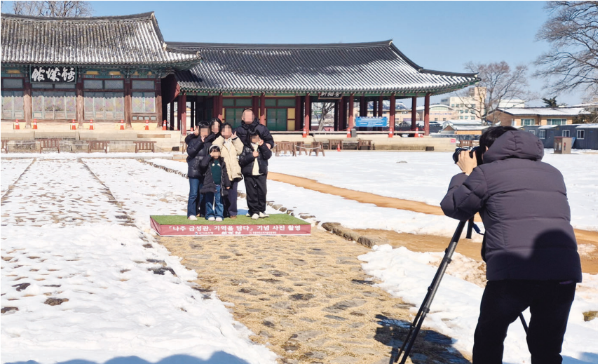
나주 금성관을 찾은 가족들이 ‘보물 금성관, 기억을 담다’ 사진 촬영 행사에 참여하고 있다.

그는 “촬영, 인화, 사진을 액자에 담기까지 5분도 채 걸리지 않지만 사진에는 스쳐 지나가는 찰나를 붙잡는 힘이 있고, 사람들의 기억에는 아주 오랜 시